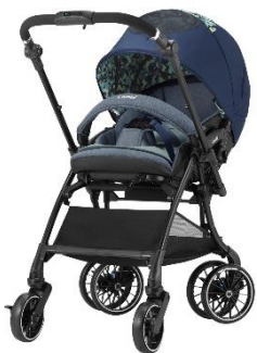
スゴカルSwitch コンビ株式会社