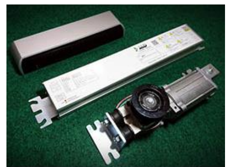
自動ドア装置「FJ3」 日本自動ドア株式会社